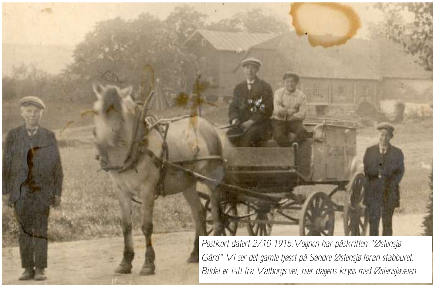
Postkort datert 2/10 1915. Vognen har påskriften "Østensjø Gård". Vi ser det gamle fjøset på Søndre Østensjø foran stabburet. Bildet er tatt fra Valborgs vei, nær dagens kryss med Østensjøveien.