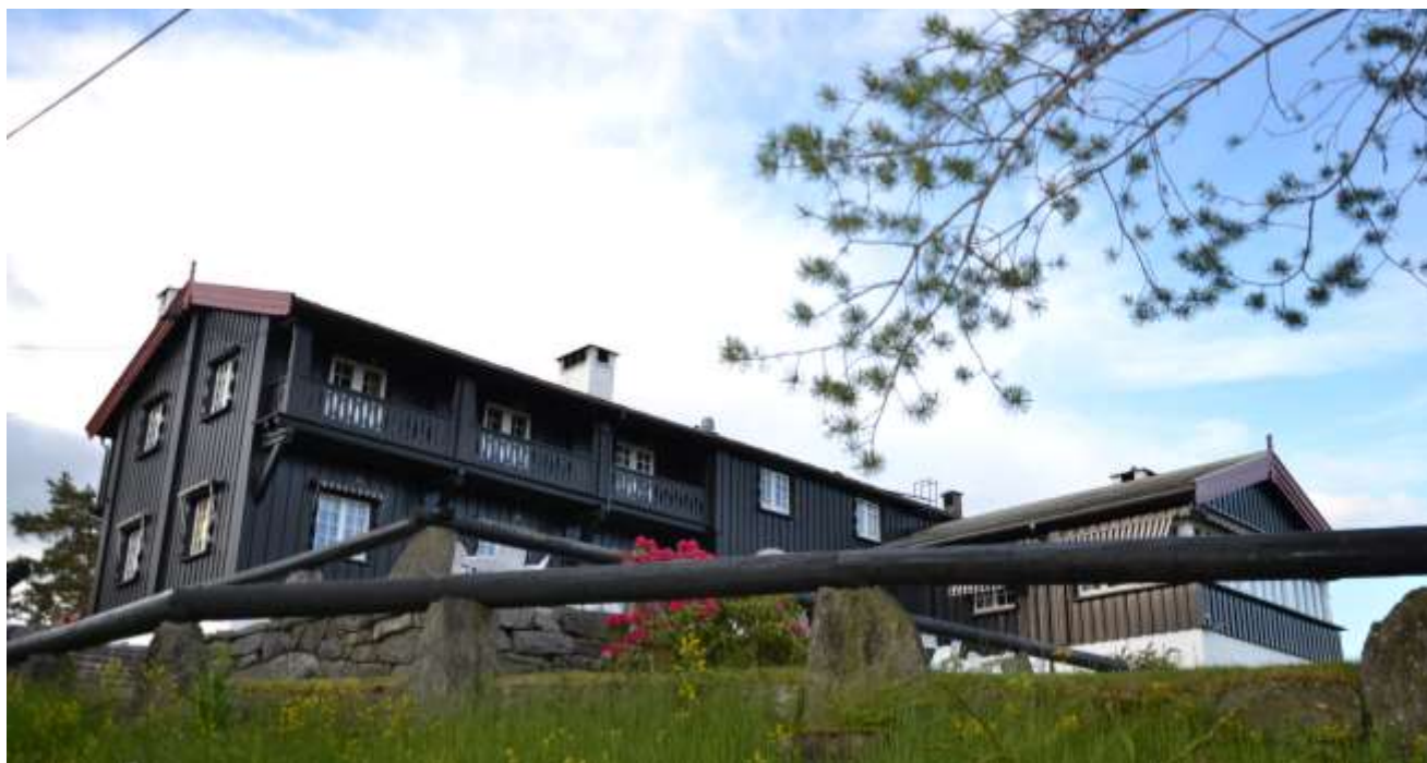
Setra i dag.

For brukerne av denne delen av Østmarka er det særlig to spørsmål som trenger seg på: Er det mulig å se for seg at man en vakker dag går tilbake til å drive sportskafe slik den opprinnelige intensjonen var, gjerne i kombinasjon med restaurantdriften? Og hva kommer til å skje med fjellanlegget; vil det bli tatt i bruk igjen og til hva? Ser en helt fram til 100-årsjubileet i 2026, er det ikke gitt hvordan Østmarksetra og kollen den ligger på kommer til å framstå. Men at det kan være rom for mer folkeliv på dette historisk viktige stedet enn i dag – det er sikkert.