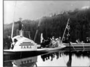
Hjulbåten «Sara» på Nøkle vann.

Sarabråten, 22. september fra kl. 12.00: