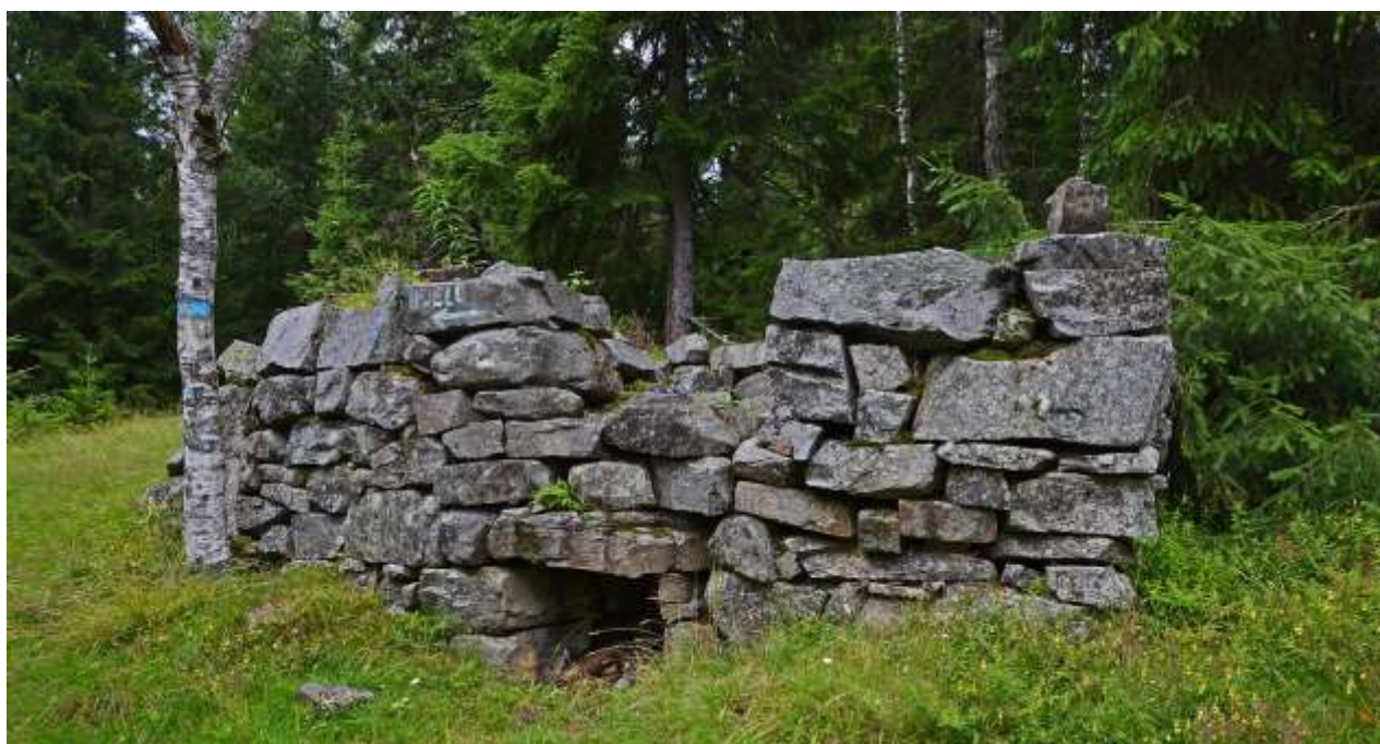
Flyktningene tok ofte rast på Holtoppsetra. Bare murene står igjen i dag

Under andre verdenskrig var det fokus på helt andre verdier. For Milorg avd 13130 var dette en hovedbase og utgangspunkt for planlegging av illegale operasjoner. Østmarka ble brukt til helt nye formål, både for å skaffe ved og mat, men også for å bekjempe okkupasjonsmakten. Milorg bygde hytter og etablerte baser og kommandoplasser. Mot slutten av krigen var Østmarka viktig i kampen for å unnsnippe tyskernes arbeidstjeneste. Max Manus beretter i sin bok «Det vil helst gå godt» om dramatiske fallskjermhopp over Østmarka. Viktig materiell for motstandsarbeidet ble levert på denne måten.