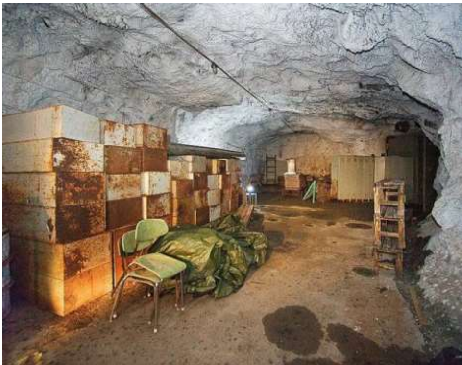
Fra fjellanlegget i 2004.

Fra midten av 70-tallet ble driften lagt om til ren restaurant og etter hvert kun lukkede selskaper. Dermed ble setra et mer eksklusivt sted; mindre tilgjengelig for den vanlige turgåer. Men maten og vinen var det iallfall ikke noe å si på; restauranten markerte seg som en av Oslos beste kjøkken – og vinkjelleren, som far og sønn Engblom har bygget opp, ble omtalt som Norges beste! Restauranten mottok på denne tiden diplom fra britiske ”The International Wine and Food Society” som første norske restaurant. Beliggenheten, den nasjonalromantiske rammen – hvem glemmer det store vikingskipet som koldtbordet anrettes på – og den gode maten har gitt en fantastisk ramme rundt et ukjent antall bryllup og andre store begivenheter opp gjennom noen tiår.