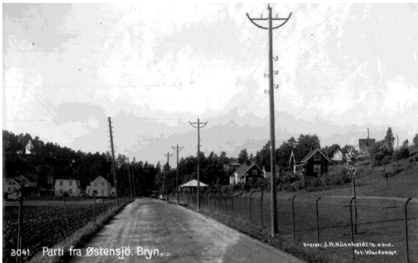
Østensjøveien fotografert mot nord fra omtrent krysset ved Haakon Tveters vei. Til høyre tomte til Østensjø skole. Østensjøveien ble først anlagt på slutten av 1850-tallet og fikk fast dekke i 1932.

selvsagt over Østensjøvannet og det var viktig at den var merket. Det ble skåret mye is på vannet og å kjøre ned i en slik råk kunne koste både hest og kjører livet. For å være sikker på at isen holdt måtte man måle tykkelsen, og tommelfingerregelen var at 5 cm is bar en mann, 10 cm en hest og 15 cm en kanon.