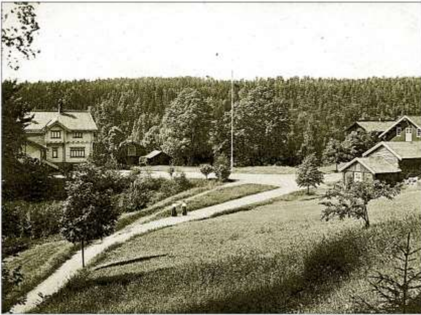
Heftye juniors hus på Sarabråten, ca 1890.