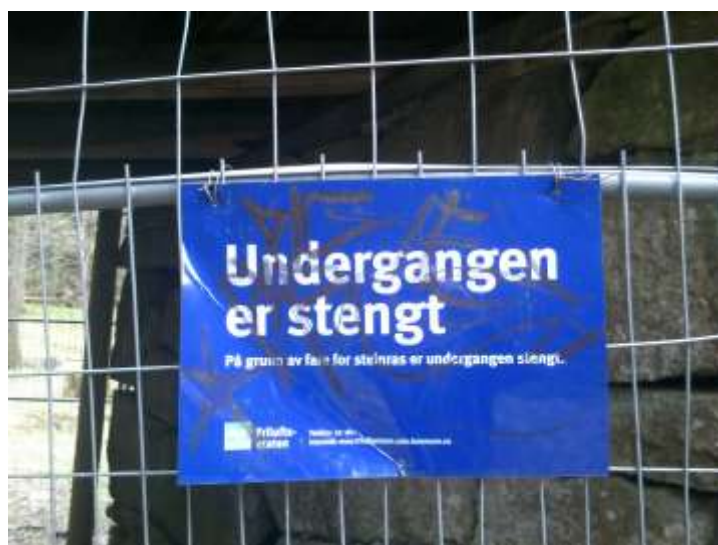
Fortsatt er undergangen til Korketrekkeren stengt

Men her, rett nord for Sarabråtveien ved Krokotrekkeren, lå det på 1800-tallet en liten plass som het