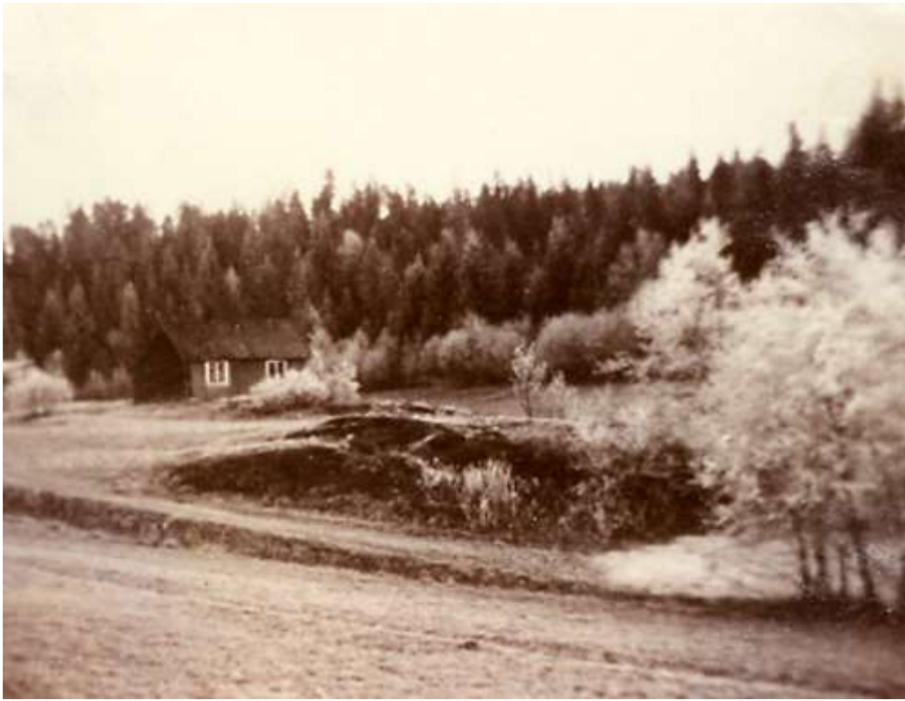
Østensjøbråten. Ukjent årstall

Turen fortsetter langs vestsiden av Nøklevann, men nærmer seg nå slutten. Rett før jeg kommer til Haraløk-