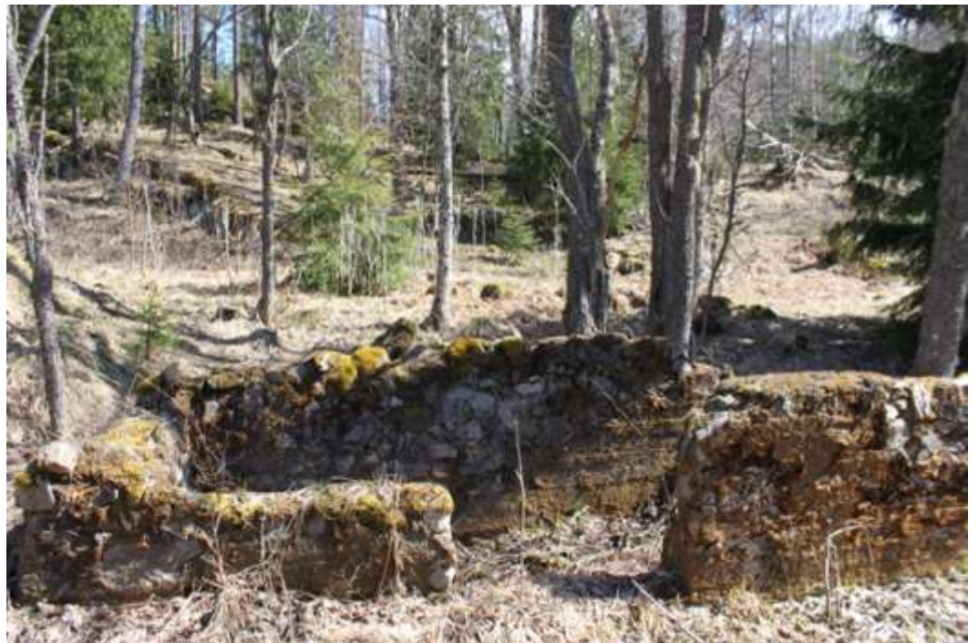
Tuftene etter Søndre Skytten

Forbi Svartkulp og tuftene etter Løken seter fortsetter stien mot Steinsjø og Vangen. Men vi fortsetter videre, for i dag skal vi ha lunch ved idylliske Tonevann! Fram med kokeapparat og kaffekjel. Og jammen fristet det også med et forfriskende bad etter måltidet.