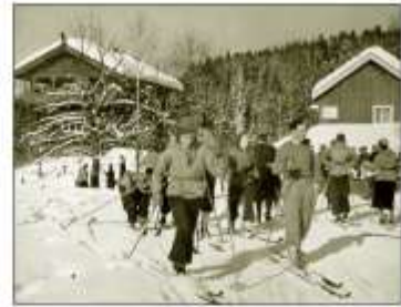
Kuskeboligen ca 1937.