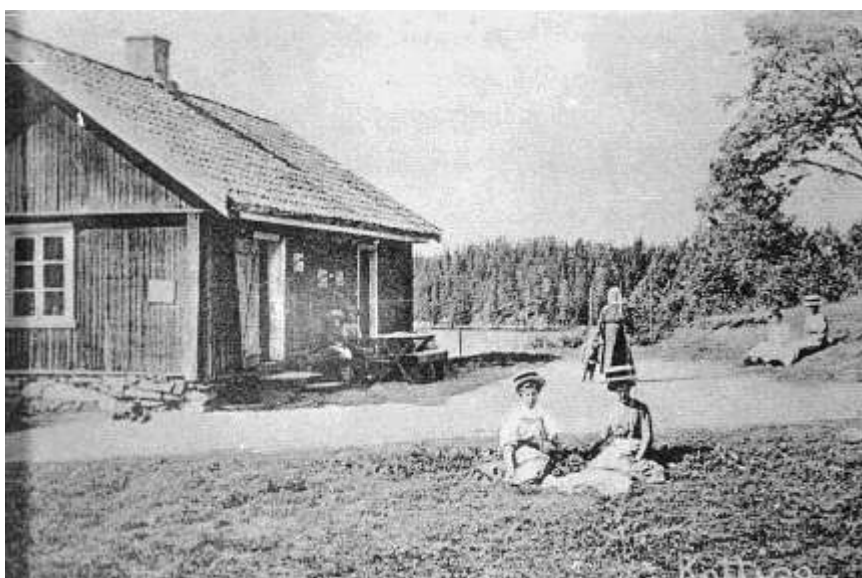
Kattisa ca 1905

og kjær person. Hun drev servering her fram til husene måtte rives i 1916. Også her var det hensynet til drikkevannet i Nøkle vann som var avgjørende.