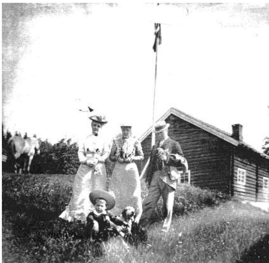
Øvre Bremsrud ca 1910.