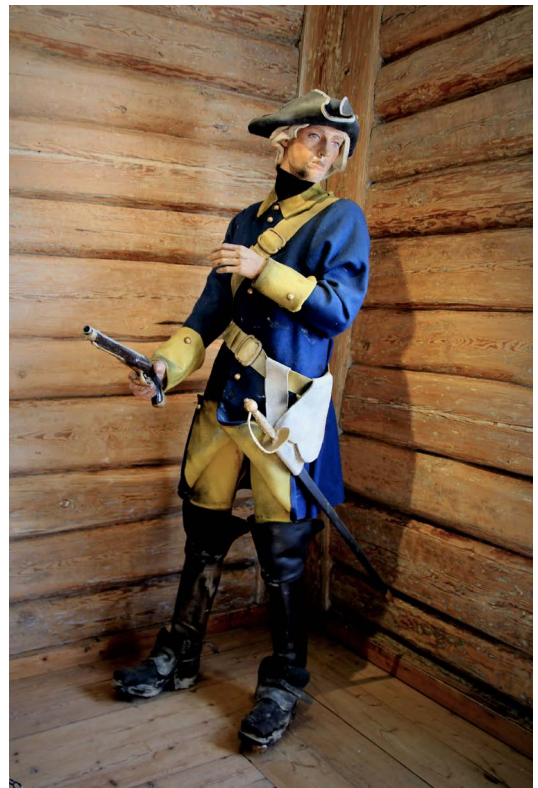
Svenske karolinere i blå og gul uniform, utstilt på museet.