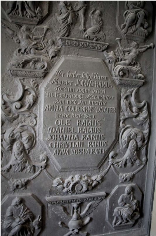
På nordveggen i våpenhuset i Norderhov kirke henger det en gravplate til minne om Ramus-slekten.