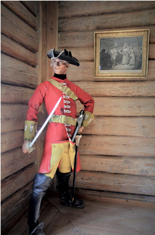
Norsk dragon i rød uniform, ustilt på museet.

som den danske dikteren Adam Oehlenschläger (1779-1850) nevner i diktsyklusen «Norgesreisen» etter et besøk på Ringerike i 1833: