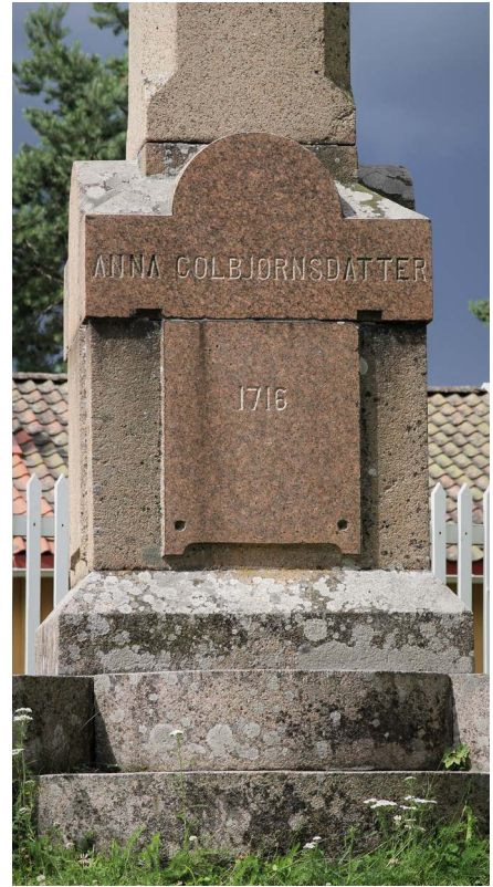
I prestegårdens hage står et gedigent monument over Anna Colbjørnsdatter 1716, etter slaget på Norderhov.