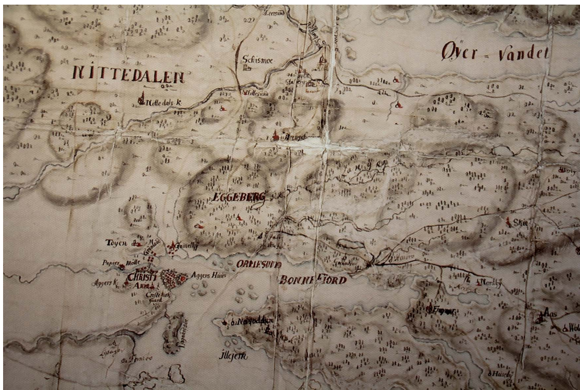
Utsnitt av kart over Østlandet 1716 i museets samling.

Det var disse levningene jeg fikk se på det litt skumle besøket i krypten for rundt 70 år siden. Intet kjente jeg den gang til om ekteparets forbindelse til Østensjø gård.