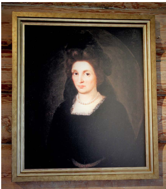
Anna Colbjørnsdatter (ca. 1665-1736), portrettmaleri fra 1701, malt da hun var 34 år, viser en vakker og mørkhåret kvinne med regelmessige trekk og med et blikk som synes å granske tilskueren. Håret er høyt satt opp etter barokkens mote. Og hun bærer et perlekjede over en utringet kjole. (Bildetekst fra utstillingen).

Spesielt Anna Colbjørnsdatter er i tradisjonen nevnt som «heltinne» fra en tid da Sverige var fienden under Den store nordiske krig 1709-1720. At hun og hennes slekt hadde vært eiere av Østensjø gård skulle det gå mange år før jeg ble kjent med.