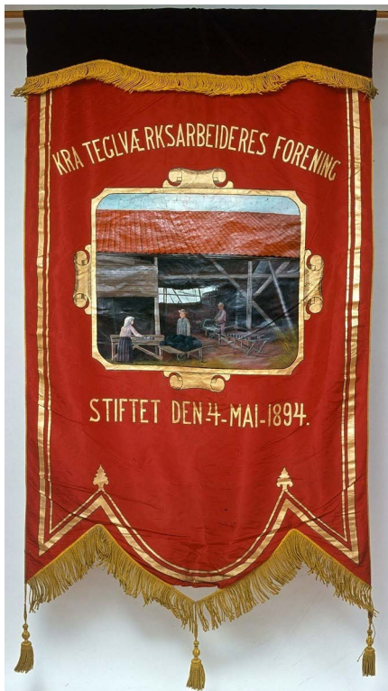
Kristiania teglverksarbeideres forenings fane. Foreningen ble stiftet 4. mai 1894.