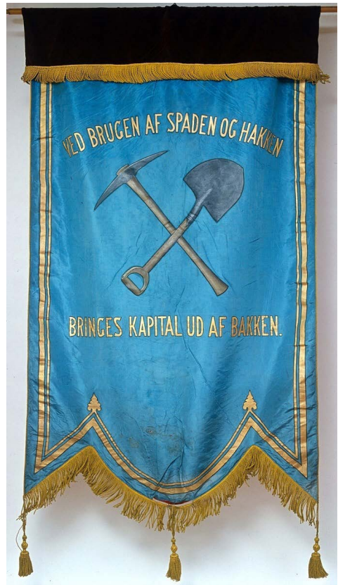
Kristiania teglverksarbeideres forenings fane. Budskapet var klart: «Ved brugen af spaden og hakken, bringes kapital ud af bakken.»

I løpet av de første tiårene på 1900-tallet, og særlig i mellomkrigstiden, opplevde teglverkene en strøm av hjemløse overnattingsgjester. Det kunne bli temmelig kaotisk på vinterens kaldeste og mest besøkte netter. Tilstrømmingen varte til godt forbi den andre verdenskrig. Teglverkene hadde en meget sentral plass i lofferens univers selv om de sjelden jobbet der. Verkslokalet beskyttet mot værgudene, og ble et sosialt treffsted for hjemløse som lengtet etter varme omgivelser. Teglverket ble en livbøye og et samlingspunkt. Tusenvis av vagabonder unnslett kjølige høst- og vinteretter ved å søke ly på verkene. Ovnsvarmen kunne nyttiggjøres på annet vis også; her kokte de kaffe, stekte flekk og frigjorde seg fra luseplagen. Avlusningen skjedde på et blunk. De holder klesplagget over varmen slik at beina på småkryperne ble svidd av, og deretter kunne de ristes av plaggene. At klærne lukter brent i ukevis fikk så være, det luktet av alle. Det fantes noen få kvinner blant lofferne på teglverket, som typisk var en pen jente som forlot hjemstedet i ung alder for å prøve lykken i hovedstaden, kom skjevt ut.