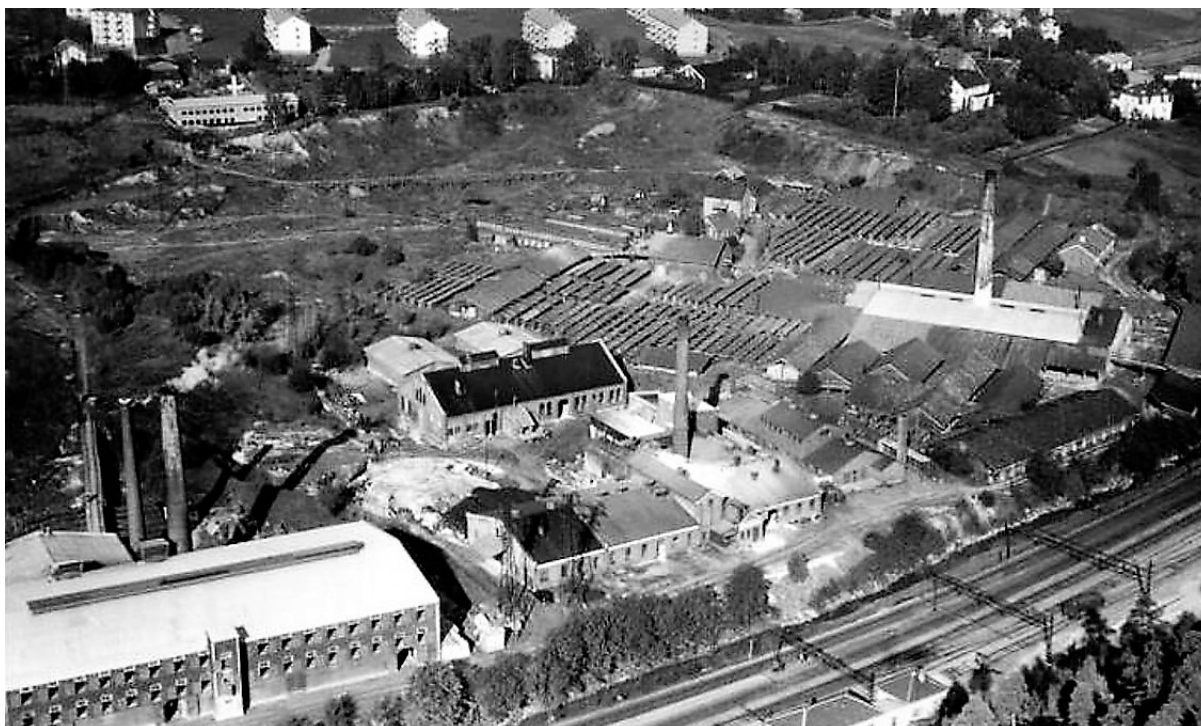
Bak leirgravene ses Teisen Park borettslag og øverst til høyre ligger Bryn skole. Tørkeloftet i nederste venstre hjørne. Widerøes flyveseskap/Otto Hansen, 1951.

på 1000 murstein levert på byggeplassen kostet opp mot 32 kroner før krakket, og falt til halvparten ett år senere.