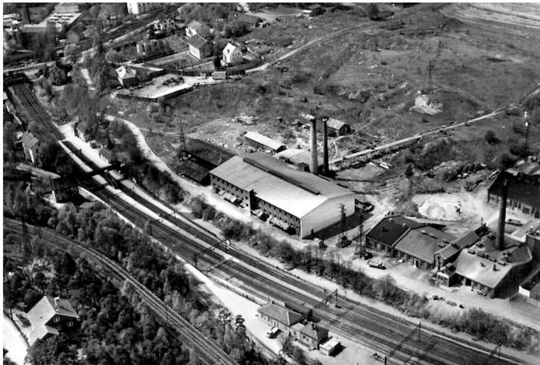
Kristiania teglverk lå like inntil jernbanen, og til høyre sees Zinkhvidtfabrikken.

Du kjenner den digre trebygningen der den ligger like nord for motorveibrua der Brynstunelen kommer ut i retning Teisen. En treetasjes bygning i bindingsverk, kledd med horisontal panel og med gavlvegg i fuget tegl. Bygningen har en grunnflate på 1915 kvadratmeter og forteller om et gammelt industrimiljø der også Erlanger Bryggeri, Bryn & Halden Tændstikfabriker, Johan Petersens lin- og bomullsvarefabrikker, Den norske Zinkhvitfabrikk, N K Nielsens Jernstøperi og Den kemiske fabrikk Norden inngikk. Ja, det lå til og med en sjokoladefabrikk på østsiden av Alnaelva nedenfor Brynsfossen, men der finnes så vidt tuftene tilbake.