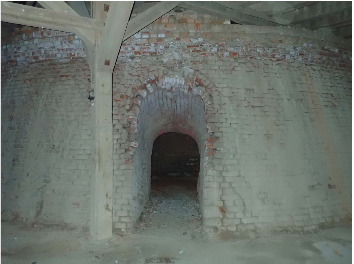
Ringovnen er trolig ett av de flotteste kulturminnene sør i Groruddalen.