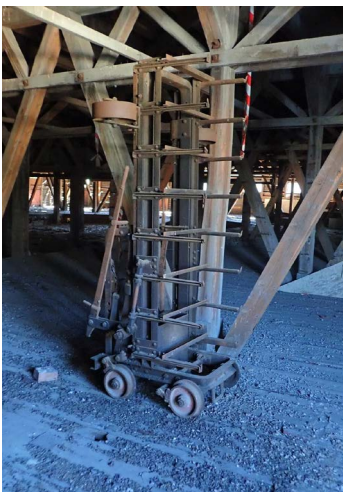
Nedenfor til venstre: Trallen ble brukt til å frakte rå teglstein til steintørka der luften drev fukten ut av steinen. Østensjø historielag, 2019.