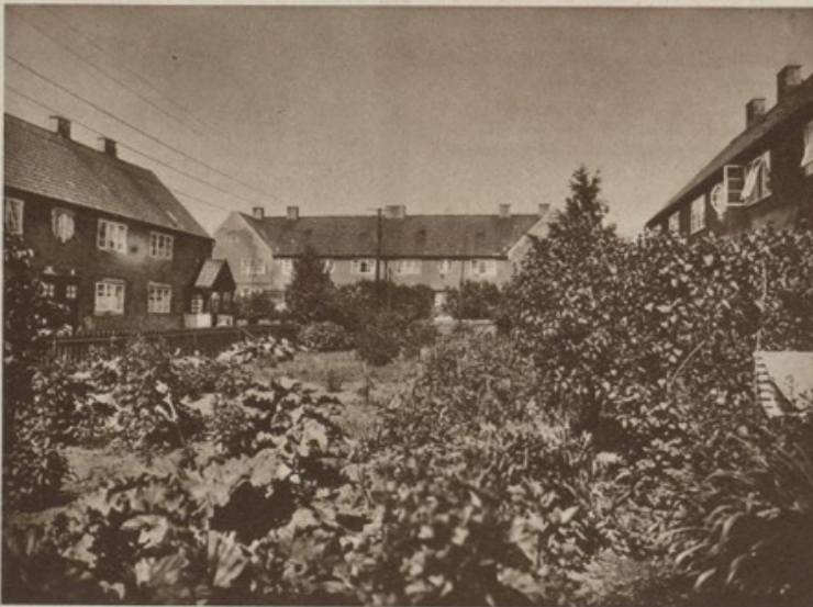
Arbeiderboliger på Grønvold.

GRØNVOLD FYRSTIKKARBEIDERFORENING — AGNES FYRSTIKKARBEIDERFORENING