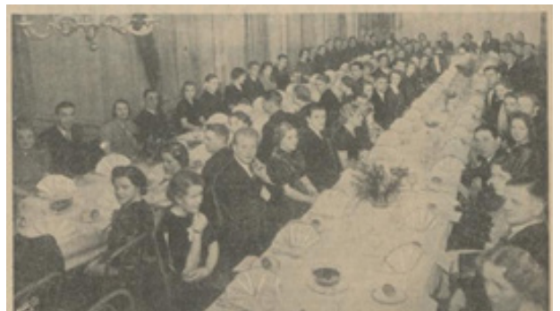
Faksimile fra Arbeiderbladet 2.1.1939