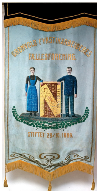
Fanen til fyrstikkerarbeiderne på Grønvold.

Opparbeidelse av banen skjer på dugnad. Etter iherdig innsats er Grønvoldbanen noenlunde klar til bruk sommeren 1914. I begynnelsen er de fleste medlemmene i Grønvold IL barn av arbeidere ved fyrstikkfabrikken. Brødrene Eriksen er selv aktive i friidrett og bidrar også som