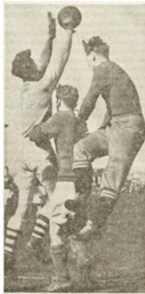
Vålerengas keeper går i nærkamp med BFG's spiss. Faksimile fra Friheten 28.3.1949:

I 1952 dør en 38 år gammel mann under en bedriftsfotballkamp på Grønvoldbanen. Dødsårsaken viser seg å være hjertelammelse. Han faller om i pausen. I etterkant får hendelsen oppmerksomhet på grunn av en lei misforståelse. Det hevdes en lege som oppsøkes i sitt hjem i nærområdet nekter å rykke ut. Se-