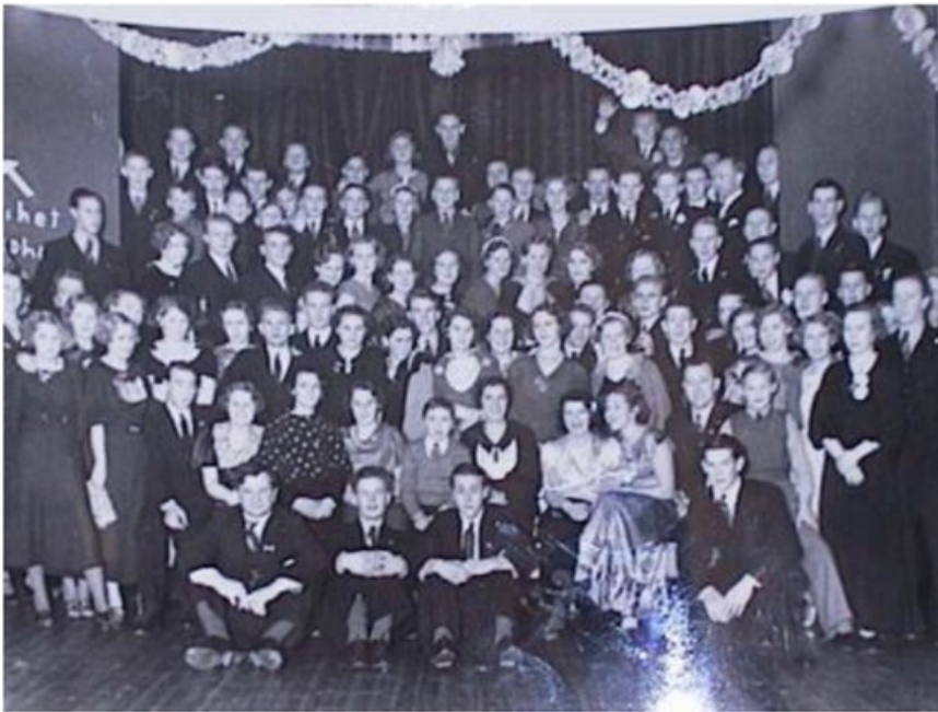
Grønvold Idrettslag holder fest for utøvere, ledere og støttespillere.