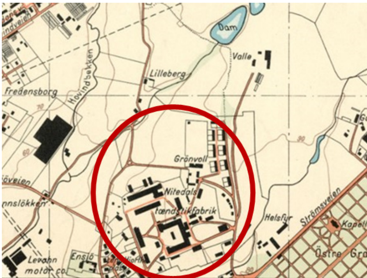
Kartet viser Grønvolds beliggenhet. Fyrstikkfabrikkene eide hele området som er omkranset av Ensjø, Lilleberg, Valle-Hovin og Helsefyr. Kart over Aker 1938, eier Oslo kommune.

Når folkehelse får økt fokus begynner idretten å vokse fram. De første idrettslagene i Østre Aker er Ski- og Fotballklubben Hasle i 1911 samt