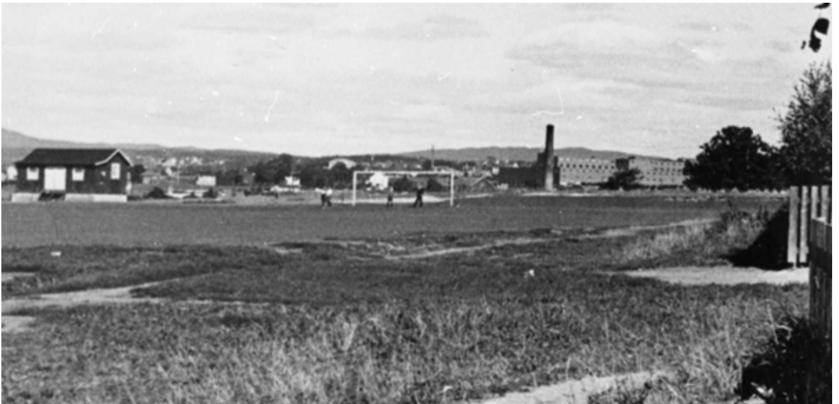
Grønvoldbanen fotografert fra hagebyen i 1933.

Når Kampen IF feirer 5 års-jubileum på Grønvold kjemper de innbudte lag om «... en vakker