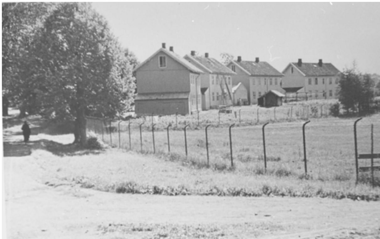
Parti sør og vest for Grønvoldbanen i 1933.

blitt oppsagt. ... Mens musikken spilte strømmet der flere og flere til, slik at det var adskillig over 500 mennesker til stede og påhørte Tranmæls ypperlige tale.»