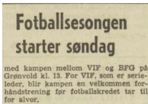
Faksimile fra Arbeiderbladet 5.4.1948

I 1946 bevilger Aker kommune 36 000 kroner til en større reparasjon av Grønvold idretts-plass. Så snart banen er utbedret, flytter fotball-gruppa tilbake fra Trasop. Klubben arrangerer i disse årene flere store juniorturneringer. Kam-pene er populære, og flere ganger kommer det