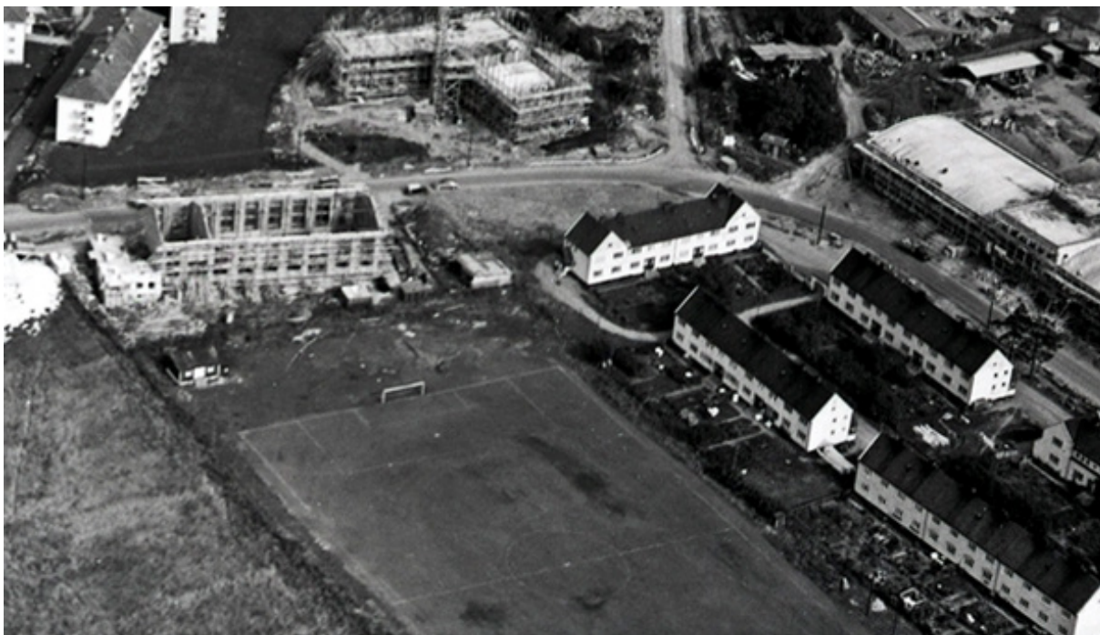
Industribygg under bygging rett nord for banen. Foto: Arbeiderbevegelsens arkiv og bibliotek, 1953

rekrutteringsgrunnlag i området og det er naturlig å trekke østover.