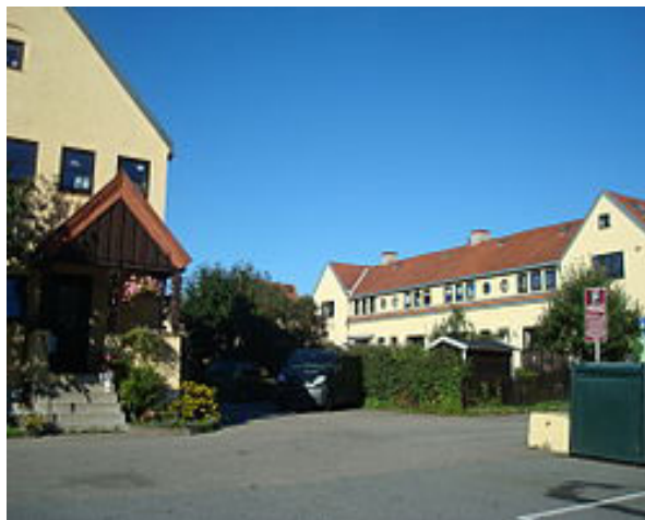
Grønvold hageby slik den ser ut i dag.

Ved inngangen til 1900-tallet er Bryn og Grorud de store industristedene i Akersdalen, og begge har egen jernbanestasjon. Langs jernbanen og Alnaelva vokser det fram en rekke industribedrifter. Her finnes blant annet bomullsspinnerier, malingfabrikker, teglverk og kjemisk industri. Fyrstikkfabrikkene på Bryn og Grønvold er blant de største bedriftene i området og sysselsetter ved århundreskiftet til sammen 1000 personer. Til tross for at begge fabrikkene har boliger bor de fleste arbeiderne på Kampen og