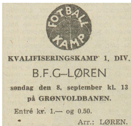
Faksimiler fra Arbeiderbladet i 1946

500 tilskuere. Også Lørens A-lag i fotball spiller nå sine hjemmekamper på Grønvold. Banen regnes for å være god. Banedekket en blanding av gress og grus, en kombinasjon som var mye brukt i de nære etterkrigsårene.