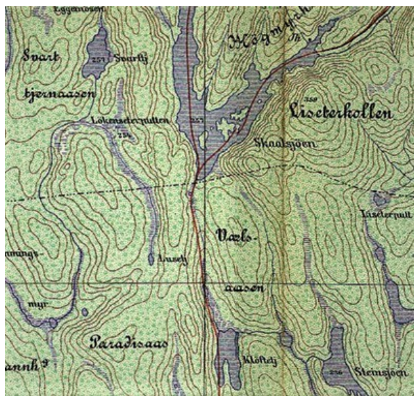
Utsnitt av kartet "Terrenget omkring Østmarkseteren og Sarabråten", Akersbanerne 1928