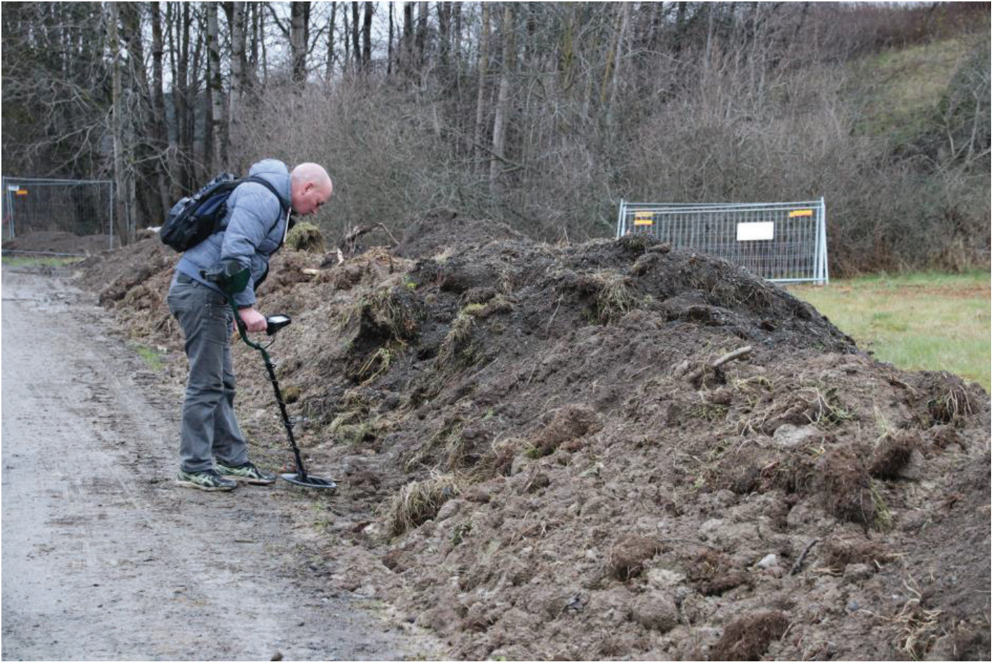
En metallsøker leter etter spor i jordmassene fra tidligere virksomhet da turveien ble lagt om i 2018.

synlig at det var henne som sto for kunnskapen om gårdsbruk i familien?!