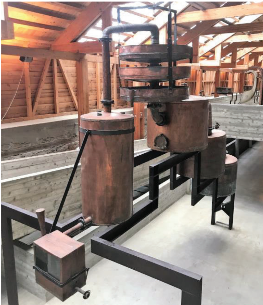
◀ Brennevinnsapparat utstilt på Storhamar-låvens nordfløy, Domkirkeodden Hamar