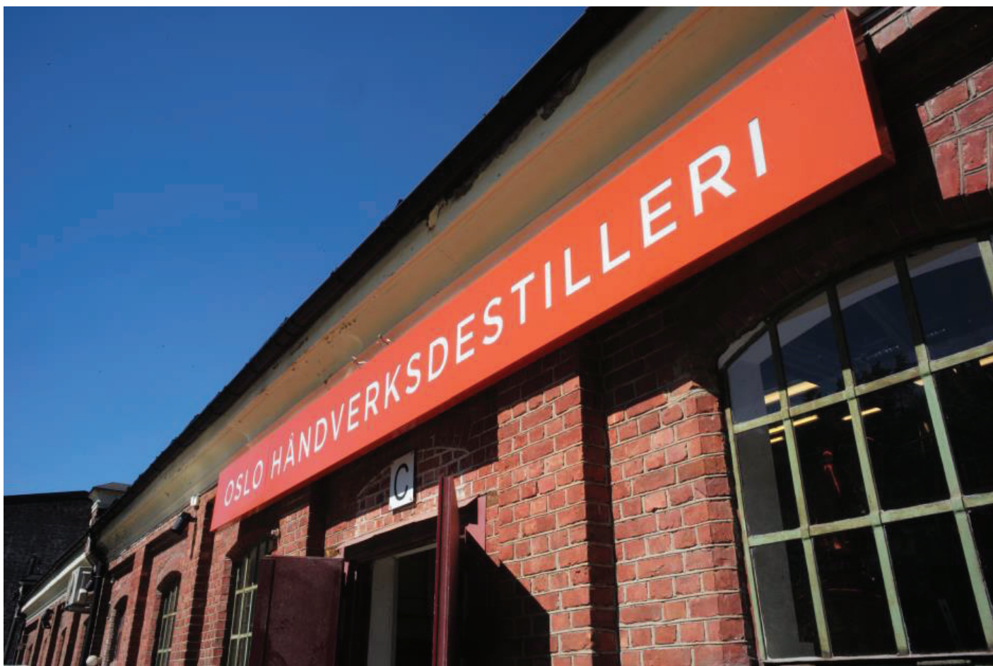
Fasaden til Oslo Håndverksdestilleri

Når brenneriloven ble opphevet i 1845 skyldes det at alkoholmisbruket var blitt et