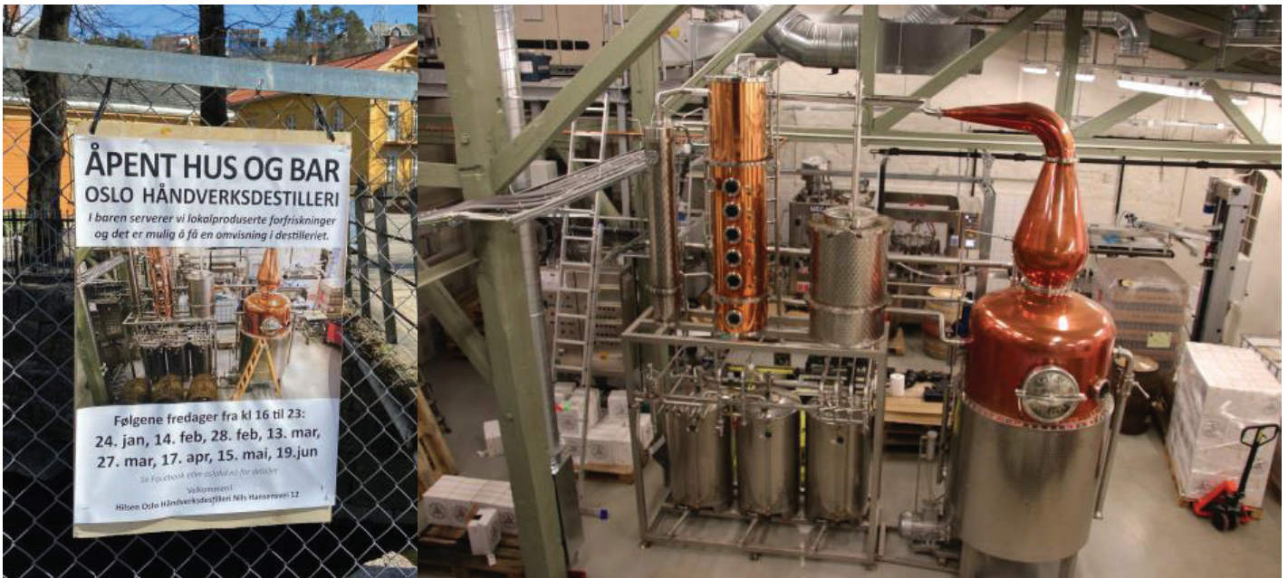
▲ ◀ Plakat ved Bryn jernbanestasjon med invitasjon til å besøke Oslo Håndverksdestilleri.