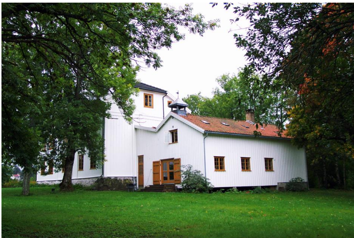
Sidebygningen på Nordre Abildsø gård med vellingklokka.