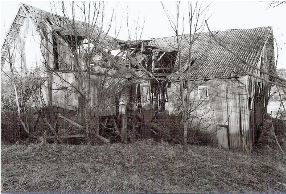
Driftsbygningen på Nordre Abildsø gård like før den falt sammen i 1989.

direkte foranledning til at forfatteren og redaktøren Jacob Breda Bull (1853-1930) tok stoffet opp til dikterisk behandling i dramaet Tordenskiold. Et historisk skuespil i tre afdelinger (1899).