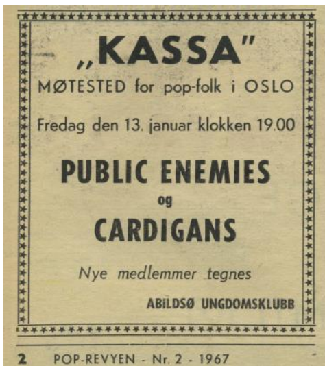
Annonse fra "Kassa", populært navn på Folkets Hus i Smedbergveien på Abildsø. POP-revyen nr. 2, onsdag 11. januar 1967, s.2.