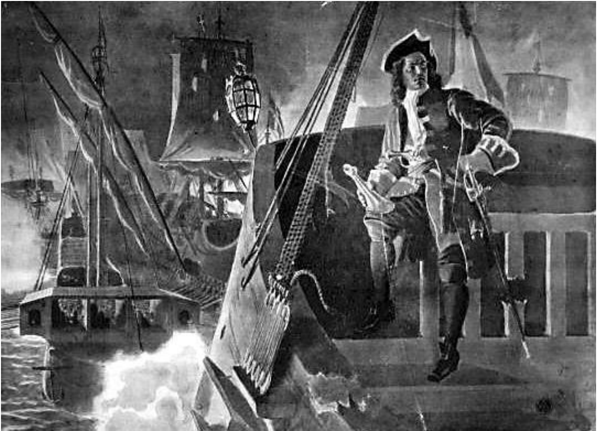
Tordenskiold til havs

Peter Wessel. Hrr. general! Hvad mente I? Laa vist noget under.