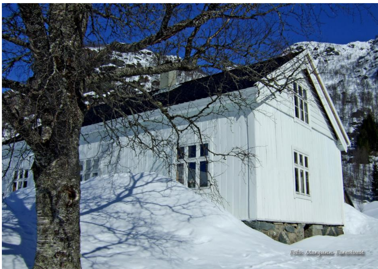
På fjellgarden Krossen eller Nygard som er det nåværende navn, øverst i Modalen, vokste Olav Nygard opp.

-Hvorfor skulle den på en kjerre? –Jo, det var ingen som hadde biler da, så alle begravelserfølger var sånn at hesten gikk foran med kista på kjerra, og hele familien og alle vennene fulgte etter».