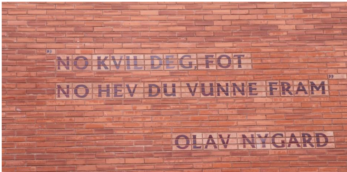
På gavlveggen til Ulsrud Borettslag finner vi Nygard-sitatet «No kvil deg fot. No hev du vinne fram», fra diktsamlingen Ved vebande i 1923, utgitt da Olav Nygard bodde på Granbakken.