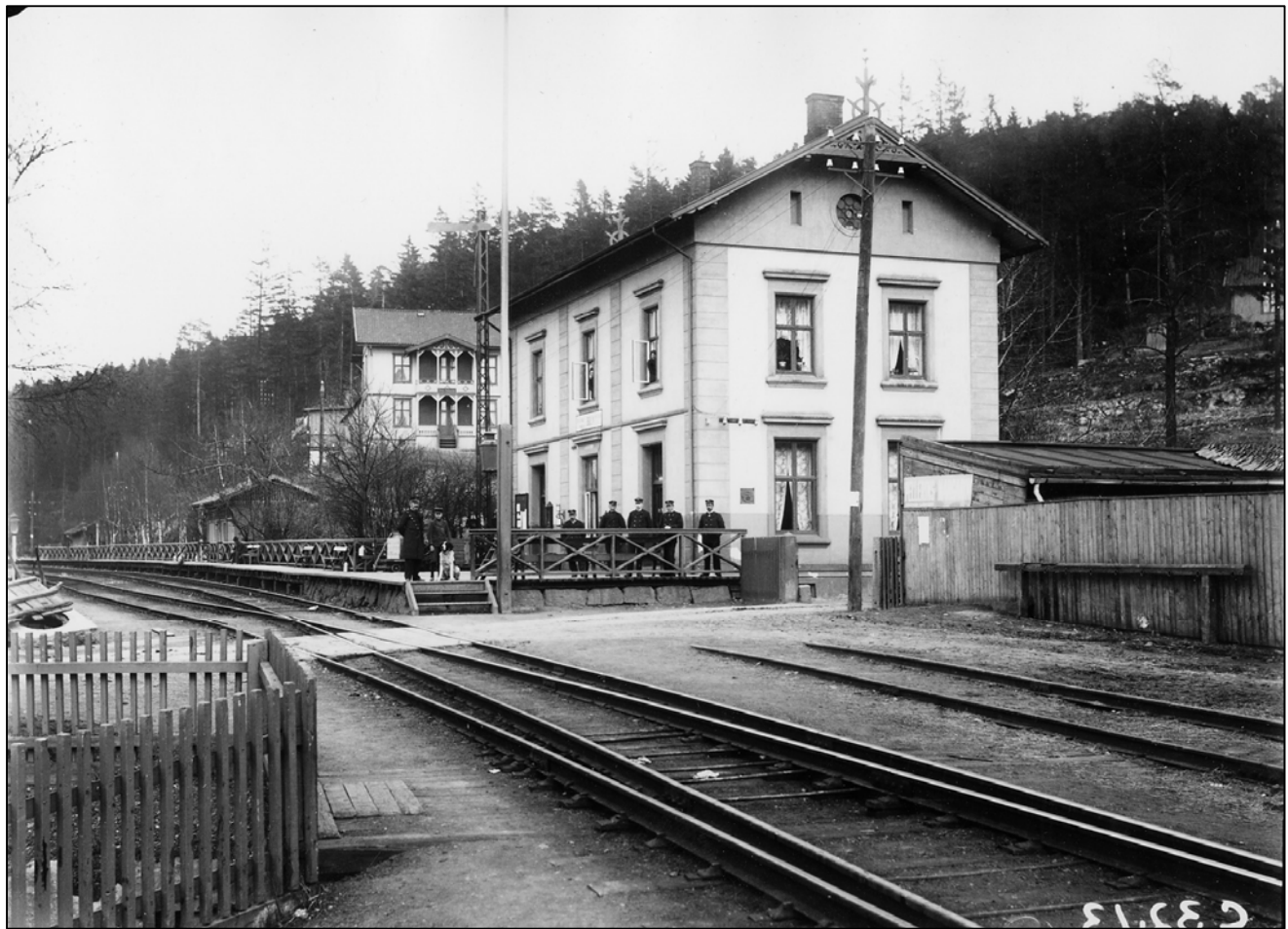
Stasjonsbygningen fra 1884. Legg merke til Østensjøveien som krysser jernbanelinjen rett foran stasjonsbygningen. Dette kan vi fortsatt se rester av i dag

Christiania skulle bl.a. løses ved å flytte mye av godstrafikken ut til Loenga. Egne godsbaner ble bygd fra Loenga til Tøyen på Gjøvikbanen og fra Loenga til Bryn på Hovedbanen. Imidlertid var det så trangt på Bryn, at godsbanen ble bygd videre helt til Alnabru. Samtidig var en i gang med å anlegge dobbeltspor mellom Christiania og Lillestrøm. Å utvide antall spor utenfor stasjonsbygningen på Bryn førte imidlertid med seg at plattformen utenfor stasjonsbygningen måtte vike. Løsningen ble å oppføre en ny enetasjes trebygning på motsatt side av sporet. Den eksisterende stasjonsbygningen skulle fortsatt benyttes som bolig for stasjonsmesterfamilien og familiene til noen andre ansatte.