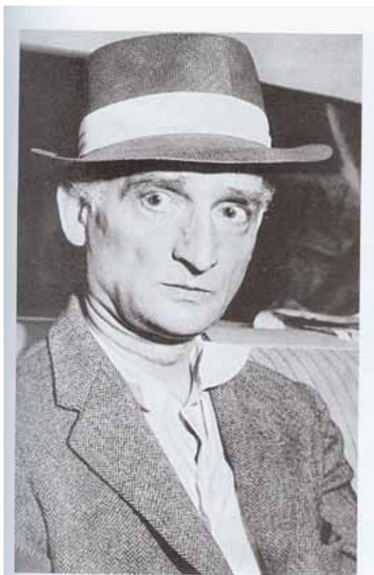
William Fisher i 1957, fra tiden med rettssaken i New York.. Fra omslaget på boka.