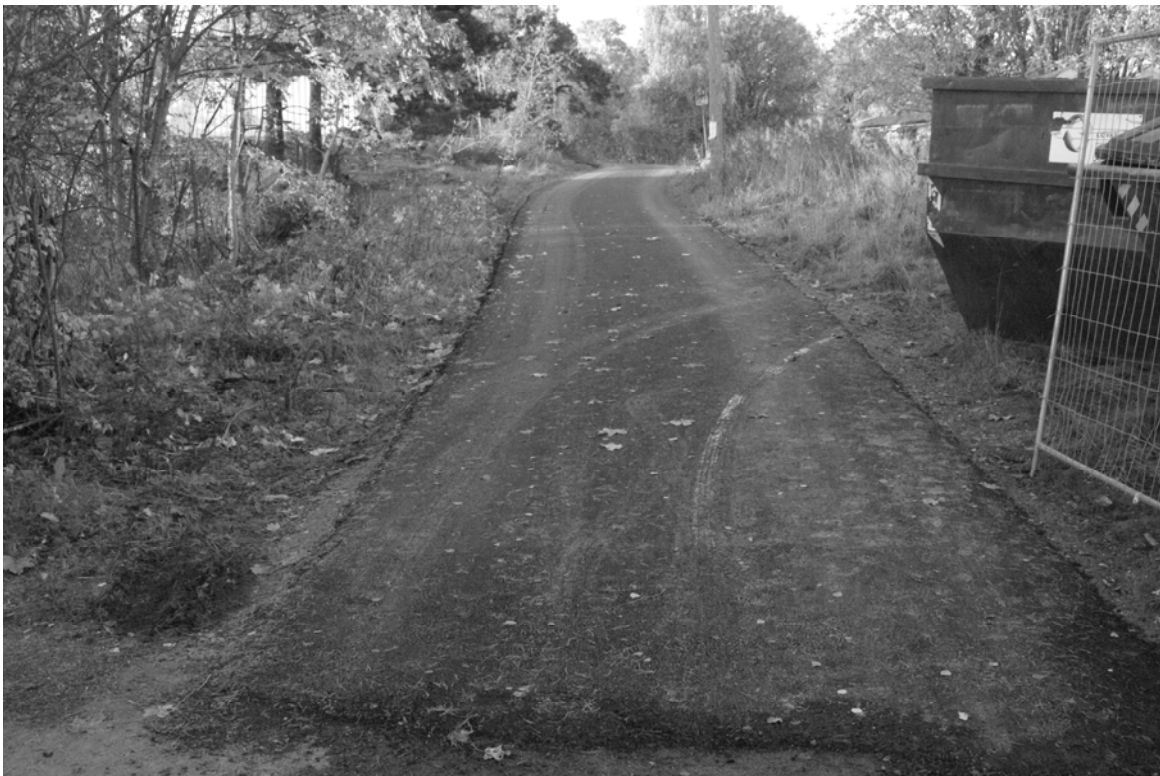
En tapt sak? Må vi framtida også finne oss i at kultur-minner som Oldtidsveien blir lagt under asfalt?