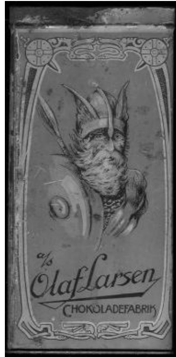
Lokket til en sjokoladeboks fra A/S Olaf Larsen Chokoladefabrik rundt århundreskiftet 1800/1900. Fabrikken opprettholdt navnet til 1930 da det ble endret til ASOLA (AS Olaf Larsen).