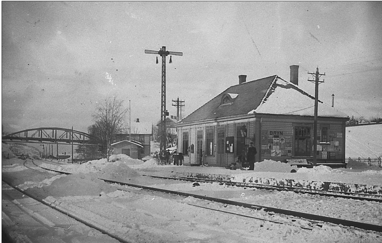
Dagens stasjonsbygning er fra 1903 og samme år ble Østensjøveien lagt i bro over jernbanelinja.