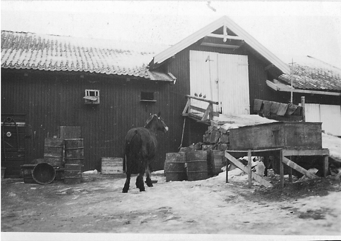
Hesten "Brann" ved låven på Bakkehavn gård ca. 1938. Driftsbygningen brant ned i 1955 og ble ikke bygget opp igjen.

1894 ble en reorganisering gjennomført og Olaf Larsen tilbød Johan Throne Holst å gå inn med kapital han hadde opparbeidet gjennom sin boligspekulasjon. Fra 1894 ble han derfor medeier og avanserte til fabrikkbestyrer fram til Freia ble omdannet til aksjeselskap i 1898. Da trakk han seg ut og etablerte samme år A/S Olaf Larsen Chokoladefabrik, som i 1930 skiftet navn til Asola – AS pluss initialene O for Olaf og LA for Larsen.